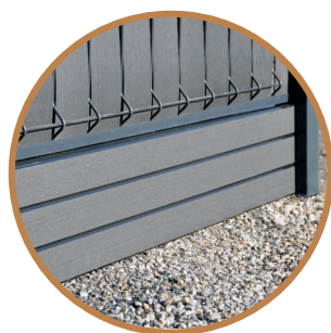
Face avec rainurage

Extrémité dans laquelle sont placés les tubes de renfort